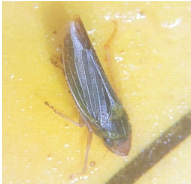
Insecto vector de la bacteria

El proceso de diseminación de la enfermedad inicia cuando las chicharritas (insectos vectores de la familia Cicadellidae), se alimentan de la savia de plantas enfermas y posteriormente transmiten la bacteria a plantas sanas. Estos cicadélidos poseen aparato bucal picador-chupador y al alimentarse de la savia, los adultos y ninfas pueden adquirir la bacteria. La savia con la bacteria es absorbida y retenida en el intestino para finalmente ser transportada al esófago donde se multiplica y forma una cápsula de protección (Gould y Lashomb, 2007).